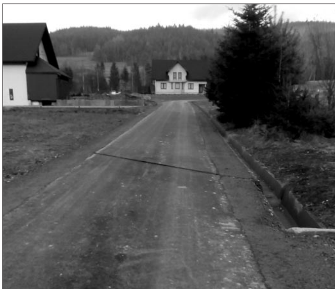
Droga do Os. Toboty w Łostówce

ków UE dotacja w kwocie 1 840 743 zł (PROW). Ze środków Wojewódzkiego Funduszu Ochrony Środowiska i Gospodarki Wodnej w Krakowie 4 119 658,00 zł (preferencyjna pożyczka z możliwością częściowego umorzenia). Ze środków Gminy Mszana Dolna: 2 097 316 zł.