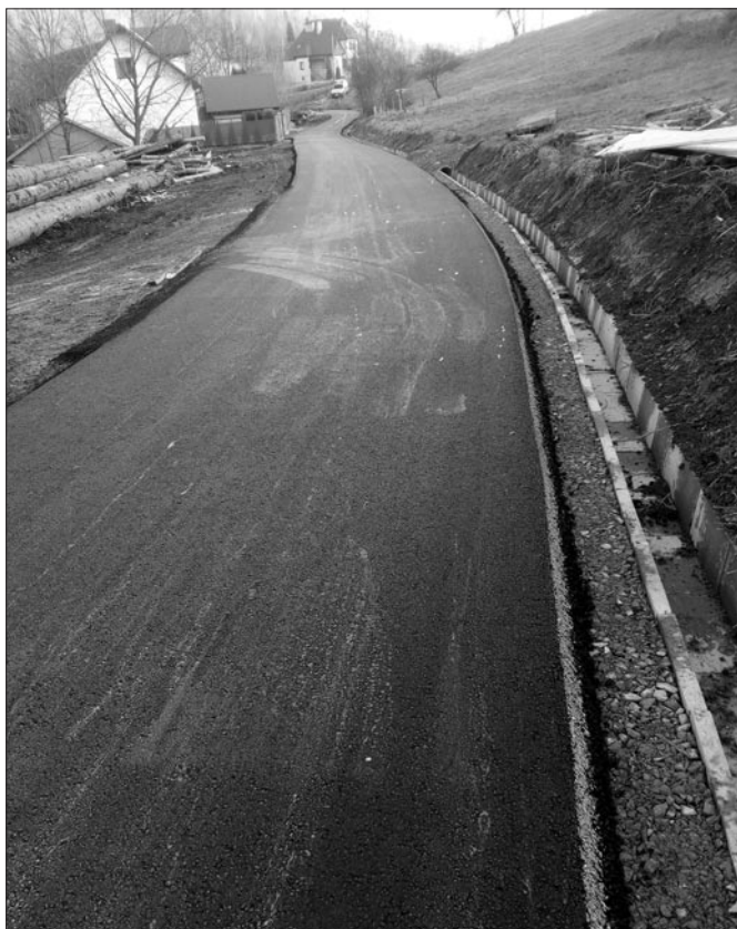
Droga do Os. Uchryny w Glisnem