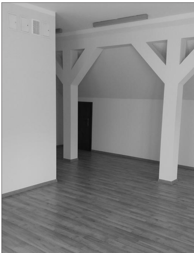
Nowe klasy w SP w Łostówce

REFERAT INWESTYCJI I ZAMÓWIENI PUBLICZNYCH UG MSZANA DOLNA