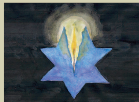
80. rocznica Zagłady Żydów w Mszanie Dolnej STR. 32