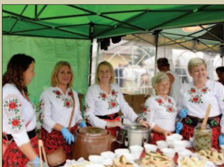
Beskidzkie rytmy i smaki STR. 20