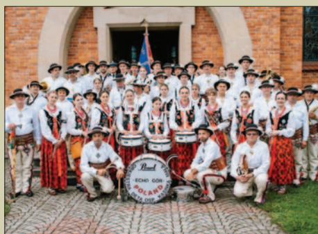
Jubileusz 110-lecia Orkiestry Echo Gór z Kasinki Matej STR. 4